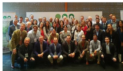
Cumbre GTF, Lima, Perú - Nov 2017

Las microempresas y las PYMES constituyen una parte sustancial del sector de productos forestales y derivados de la madera a nivel mundial. Existen en todos los eslabones de las cadenas de suministro de productos forestales y derivados de la madera, desde los propietarios de los bosques hasta los fabricantes de productos finales.