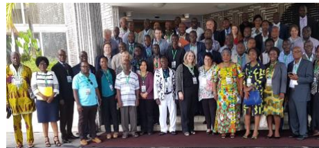
Cumbre GTF, Libreville, Gabón - junio de 2018

Las PYMES están en gran medida excluidas de los principales foros y procesos nacionales e internacionales centrados en la deforestación. Sus voces se ven ahogadas por operadores más grandes que tienen diferentes prioridades. Por lo tanto, los programas de cumplimiento legal y sostenibilidad deben responder a las necesidades de las PYMES y estar