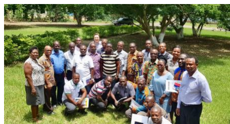
GTF Academy para apoyar las comunicaciones FLEGT, Ghana - marzo de

Los Acuerdos Voluntarios de Asociación (AVA), un componente del Plan de Acción de Aplicación de la Ley Forestal, Gobernanza y Comercio (FLEGT) de la Unión Europea, son acuerdos comerciales entre la UE y los países productores de madera que tienen como objetivo hacer que el comercio dependa de un sistema de garantía de la legalidad de la madera (TLAS) adaptado a las leyes de los países asociados.